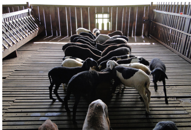
Fig.1. Intoxicação por sal em ovinos. No fundo da baia, a abertura de acesso ao bebedouro permite que apenas dois animais bebam ao mesmo tempo.

A doença ocorreu nos meses de junho a agosto de 2011, em uma propriedade localizada no município de Benevides, Pará. Na propriedade eram criados 545 ovinos das raças Santa Inês, Dorper, Texel e seus mestiços. Os adultos eram mantidos em regime de semi-confinamento com acesso a pastagens de Brachiaria humidicola e Panicum maximum cv. Massai e os jovens, em confinamento. Quando estabulados os ovinos eram mantidos em apriscos suspensos com piso ripado, em baias de 25 ou 50m 2 , com uma taxa de lotação nas baias ao redor de 0,5m 2 por animal adulto. O fornecimento de água era feito em bebedouros com 51cm de comprimento, 39cm de largura e 14cm de profundidade com fluxo de água regulado por boia. O acesso ao bebedouro era possível a dois animais por vez, através de duas aberturas na parede de cada baia (Fig.1). As baias menores possuíam um bebedouro e as maiores, dois. Os ovinos jovens recebiam como volumoso, capim elefante ( Pennisetum