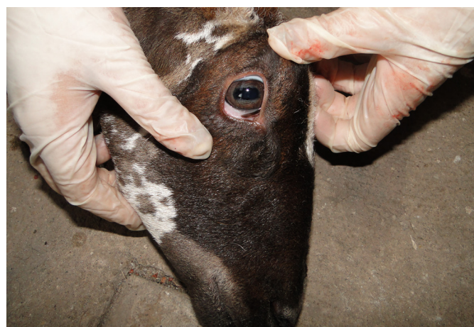
Fig.3. Intoxicação por sal em ovinos. Ovino 3 com estrabismo dorso-medial.

em um animal observou-se diarreia. Com relação ao sistema urinário o sinal observado foi micção frequente (2/8). Além disso, observaram-se taquicardia (3/3), hiperemia da mucosa ocular (1/8), diminuição do turgor cutâneo (2/2), enoftalmia (2/8), dorso arqueado (2/8), hipertermia (1/3) e inquietação. A evolução do quadro clínico nos animais que morreram variou de 2 horas e meia a 48 horas. Nos animais que se recuperaram não foi possível determinar com exatidão o período de evolução do quadro clínico.