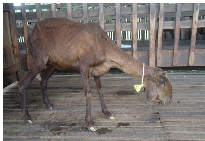
Fig.2. Intoxicação por sal em ovinos. Ovino 5 em estação com a cabeça baixa e os membros abduzidos.

Sinal clínico: +++ acentuado, ++ moderado, + leve, (+) discreto, - ausente; NA = não-avaliado, P = presente. Reflexo: O = normal, D = diminuído.