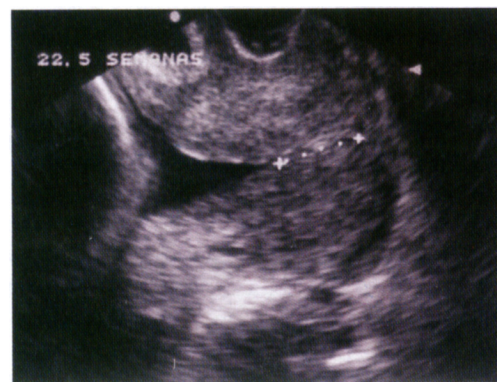
Figura 2 - Exame ultra-sonográfico evidenciando colo uterino em corte longitudinal. Observam-se o sinal do "afunilamento" e comprimento do colo reduzido. Não foi evidenciado o EGE.