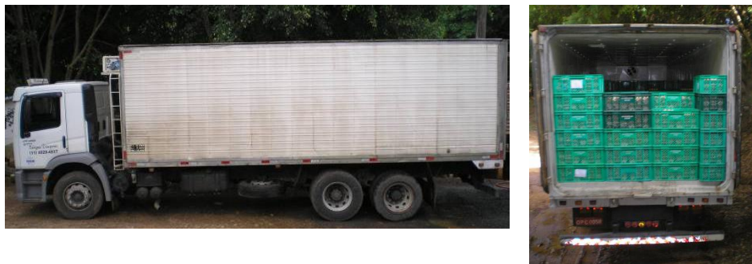
FIGURA 1. Caminhão de transporte climatizado carregado de ovos férteis utilizado na pesquisa. Acclimatized transport trucks loaded with fertile eggs used in this study.

As caixas de transporte de ovos possuíam as dimensões externas de 63 cm de comprimento, 32,5 cm de largura e 30 cm de altura, e espessura de 3 mm, com aberturas nas laterais de 3,2 cm x 1,1 cm e no fundo de 2 x 2 cm. Cada caixa suportava 240 ovos, que equivalem a 8 bandejas de plástico com as dimensões de 30 x 30 cm, com capacidade de 30 ovos.