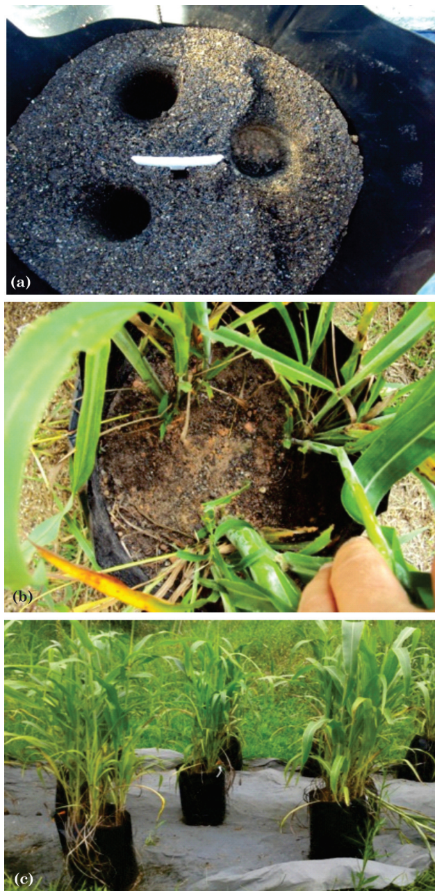
Figura 1. Aspectos do experimento de produção de inoculante micorrízico on farm : (a) Saco com substrato e orifícios pronto para receber mudas de sorgo pré-colonizadas com fungos micorrízicos arbusculares; (b) Plantas de sorgo após 30 dias do transplante; e (c) Disposição dos sacos sobre manta geotêxtil para evitar o contato com o solo.

O número de esporos de FMAs indígenas nos substratos inoculados com D. heterogama não diferiu