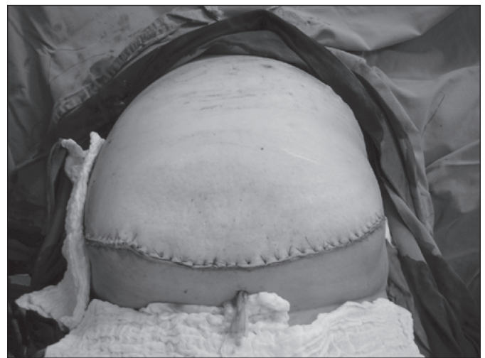
FIGURA 6. Paciente n° 1 no pós-operatório imediato de cirurgia realizada após 15 dias de pneumoperitônio