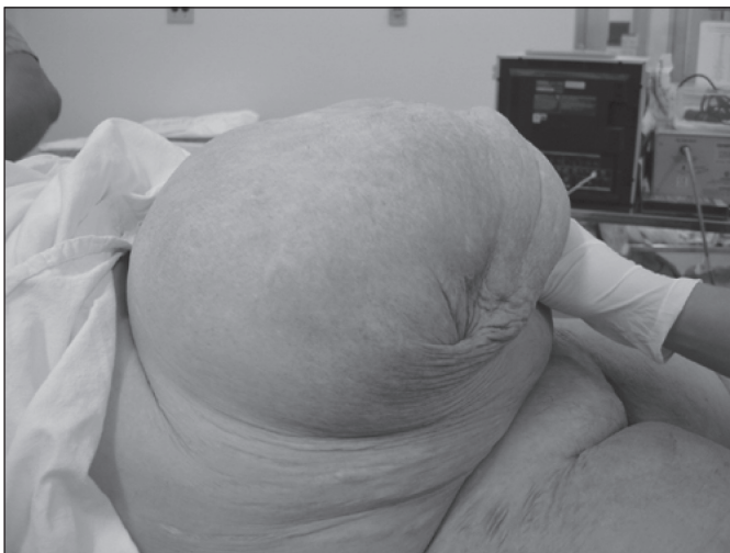
FIGURA 5. Paciente n° 1. Grande hérnia umbilical, imediatamente antes da instalação do pneumoperitônio

Embora o pneumoperitônio progressivo pré-operatório tenha partido de bases científicas, a determinação do volume