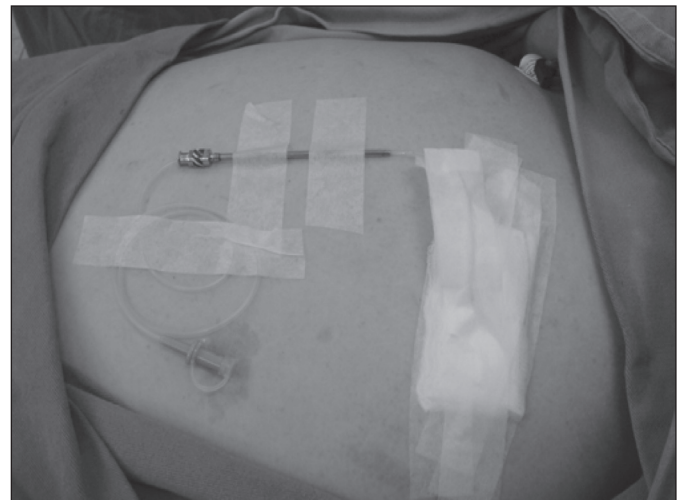
FIGURA 2. Paciente nº 2. Pneumoperitônio instalado no centro cirúrgico sob anestesia local. O cateter de Levine nº 6 encontra-se fixado no hipocôndrio esquerdo. Observe a camisa da agulha de Coope, que fica até o final do procedimento ou pode ser retirada através do posicionamento de um cateter utilizando um fio guia

punção com agulha de Coope, pela qual é passada uma sonda de Levine nº 6, que é fixada à pele. Uma torneira de três vias é conectada à extremidade do cateter.