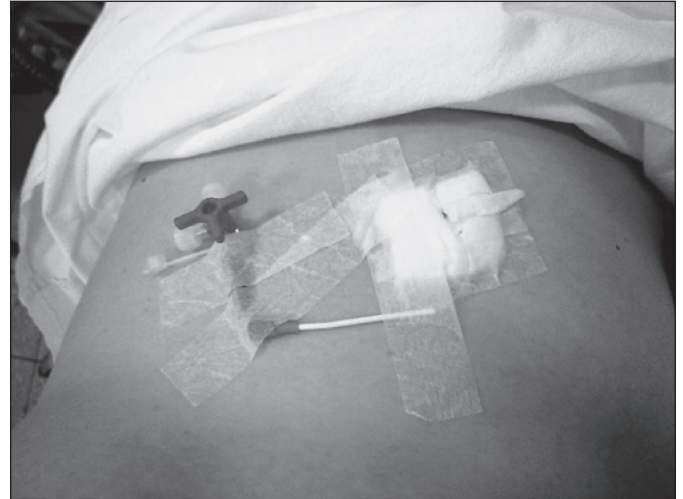
FIGURA 1. Paciente nº 3. Pneumoperitônio instalado na enfermaria com venocatch. A figura mostra a retirada do cateter pouco antes da cirurgia, quando foi esvaziado o pneumoperitônio

Após a antisepsia da parede abdominal foi realizada a anestesia local e raramente a geral. Para a insuflação de ar, em pacientes não excessivamente obesos, um cateter deve ser inserido na cavidade abdominal através de uma punção com um “venocatch” (Figura 1). Por outro lado, nos pacientes muito obesos, o procedimento é realizado com uma agulha de Veress, de maneira idêntica à da laparoscopia (Figura 2). Nesses casos, o paciente deve ser levado ao Centro Cirúrgico, sendo insuflado gás carbônico até que o pneumoperitônio esteja instalado (aproximadamente 2 L). Em seguida, é realizada uma segunda