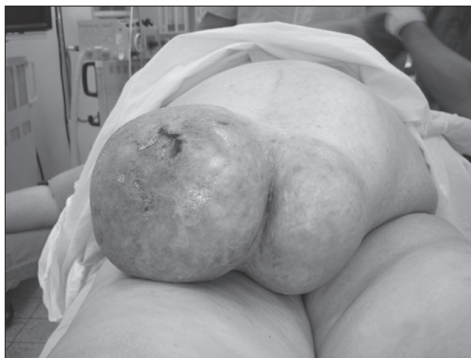
FIGURA 3. Paciente nº 2. Grande hérnia incisional infraumbilical, com lesões da pele, tratadas por 15 dias, imediatamente antes da cirurgia

O restante dos casos recebeu apenas uma dose de antibiótico profilático na indução anestésica (cefazolina) e mantido por, no máximo, 24 horas.