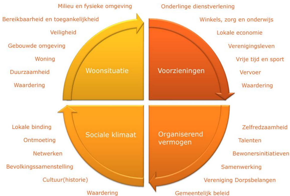
Figuur 1. Vier domeinen en aspecten van de leefomgeving

De adviezen worden gegeven aan de hand van het onderzoeksmodel voor de leefomgeving (figuur 1). In hoofdstuk 2 staan adviezen over de woonomgeving, in hoofdstuk 3 over de voorzieningen, in hoofdstuk 4 over het sociale klimaat en tenslotte in hoofdstuk 5 over het zelforganiserend vermogen in Nieuw-Balinge.