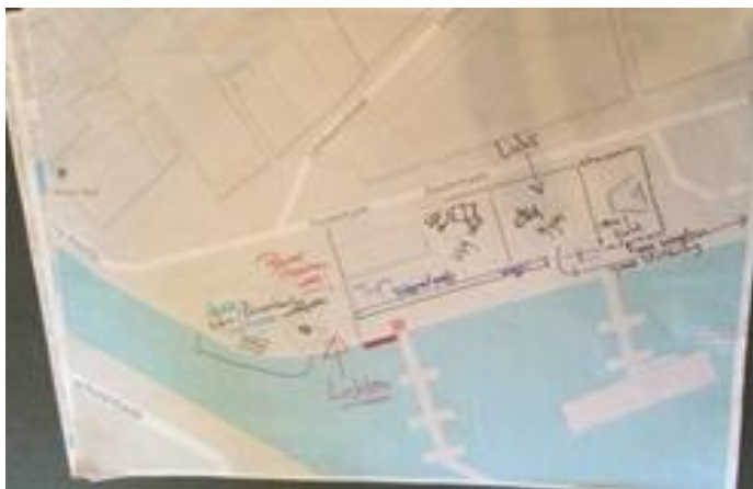
Uitwerking ideeën (groep 1), oktober 2015