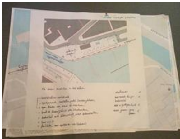
Uitwerking ideeën (groep 2), november 2015