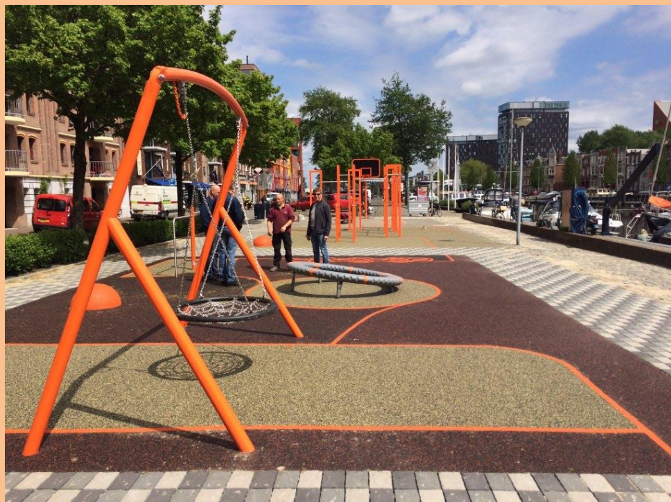
Eindresultaat sport- en speelplek Oosterkade, juni 2015