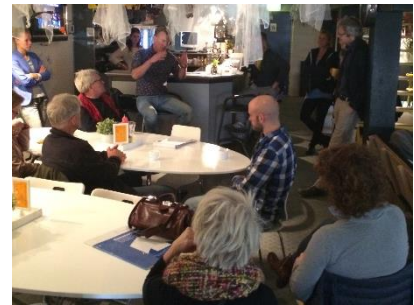
Bijeenkomst Oosterkade, oktober 2015

De Oosterkade met en voor de bewoners en andere stakeholders als een inspirerende en vernieuwende plek inrichten voor jong en oud die daadwerkelijk uitnodigt om te sporten, spelen en elkaar te ontmoeten.