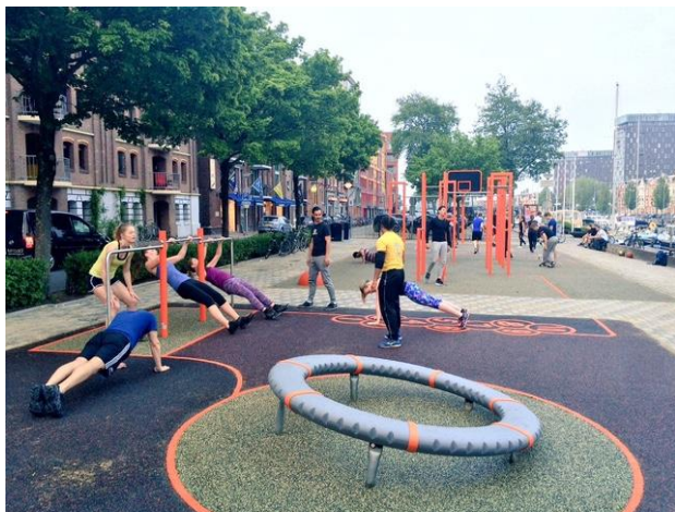
Sport- en speelplek Oosterkade in gebruik, juni 2016