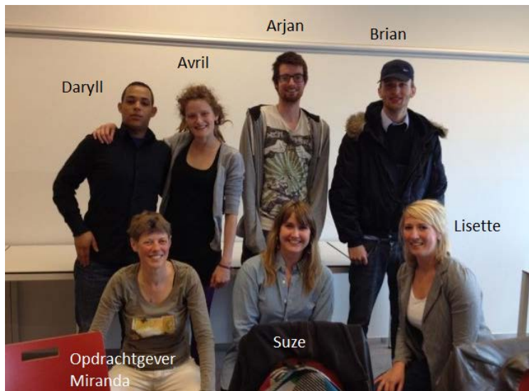
Het onderzoeksteam. (Projectleider Lennie Haarsma staat niet op de foto).