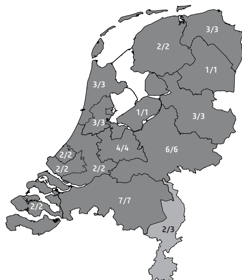
Figuur 5.2 Roc's met ZAT naar provincies/groot- stedelijke regio's, 2010 (in aantallen, N=44)

De getallen in de kaart representeren het aantal roc's met een of meer ZAT's (vermeld in de teller) en het aantal roc's in de regio (vermeld in de noemer).