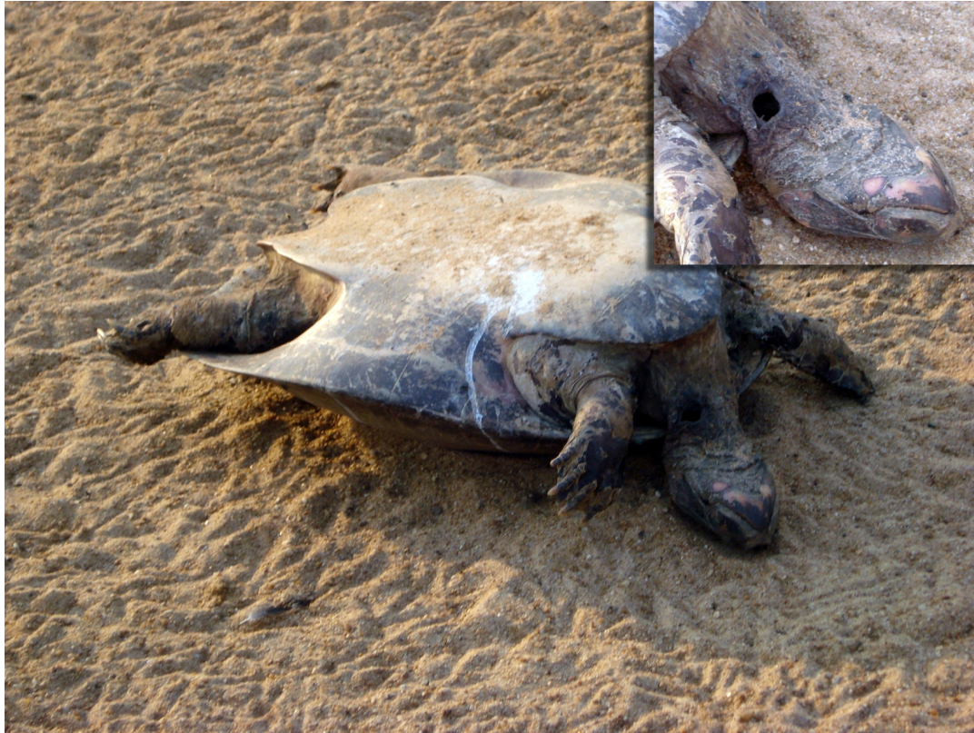
Figura 2. Fêmea adulta de P. expansa predada por P. onca após realizar desova na praia Canguçu, no detalhe marcas do ataque no pescoço da fêmea.

Figure 2. Adult female of P. expansa predated by P. onca after the nesting time in the Canguçu beach, details show the marks of the attack on the female neck.