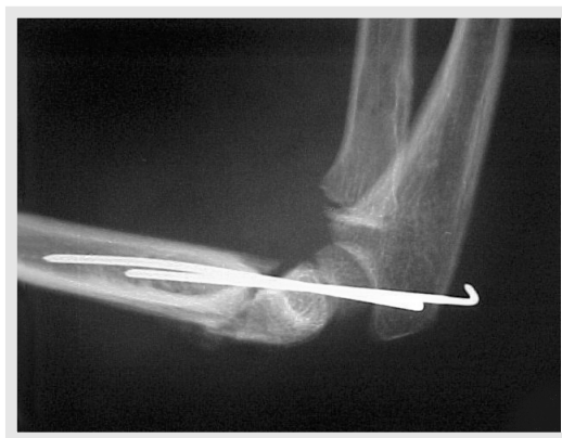
Figura 4 - Raio X - Perfil - Pós-operatório imediato com 2 fios de Kirschner cruzados. Figure 4 - X-Rays - Profile - Immediate post-operative with 2 Kirschner Crossed threads.

o risco de lesão do nervo ulnar, também pode ser utilizado 2 pinos pelo lado do epicôndilo lateral, que também cruzam a fratura, indo em direção e perfurando a cortical proximal oposta (8) .