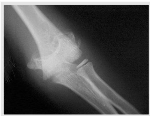
Figura 3 - Raio X - AP. Figure 3 - X-Rays - AP.