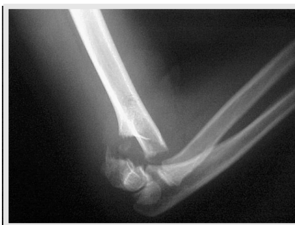
Figura 2 - Fratura Supracondiliana Tipo III em criança de 7 anos. Raio X - Perfil.

Quanto ao tratamento cirúrgico ter sido realizado em 76% dos casos, devemos considerar que como o tipo II de fratura possui uma cortical óssea posterior intacta com estabilidade mantida, é considerado o uso de 2 pinos laterais. Os pinos podem ser utilizados em paralelo ou cruzados próximo ao local da fratura. Assim, de forma paralela, não há risco de lesão do nervo ulnar, que constitui uma complicação do tratamento cirúrgico (8) . No tipo III de fratura, o tratamento se assemelha ao das fraturas do tipo II quando essas necessitam de cirurgia. No entanto, a maior probabilidade de lesões neuro-vasculares nas fraturas com descontinuidade da cortical faz com que o procedimento cirúrgico seja quase obrigatório em todos os casos de fratura tipo III. Para o tratamento, a redução e a fixação percutânea com dois fios de Kirschner cruzados constitui o tratamento de escolha, sendo realizado em 48% dos casos levantados (Figuras 2,3,4,5). Para evitar