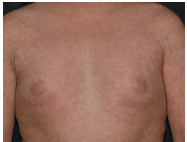
FIGURA 3: Poiquilodermia da pele do tronco. Hipodesenvolvimento das mamas

seqüencialmente, nos membros superiores e inferiores. Após meses ou anos, as lesões adquirem progressivamente aspecto poiquilodérmico, pela associação de atrofia cutânea, despigmentação mosqueada e telangiectasias. 2 A histopatologia de lesões bem estabelecidas mostra atrofia da epiderme, com hiperqueratose e hiperpigmentação da camada basal. Há fragmentação de fibras elásticas na derme, rarefação de anexos e derrame pigmentar. 4 A maioria dos pacientes