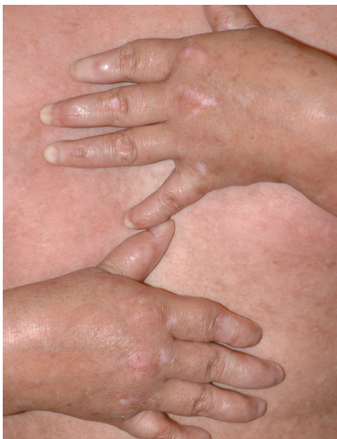
FIGURA 2: Mãos de diâmetro reduzido, e hipoplasia do quinto quirodáctilo