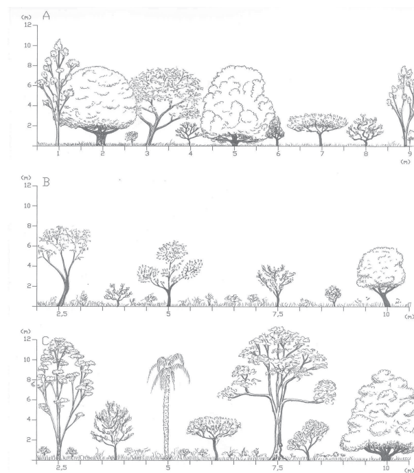
Figura 2 – Perfis-diagrama da revegetação com espaçamentos: 6 x 1 m (perfil A); 3,5 x 2,5 m (perfil B); e 3,5 x 2,5 m (perfil C) na Mineração Cinco Lagos. O perfil C corresponde a uma área localizada próxima a um fragmento remanescente de vegetação nativa.

Figure 2 – Profile of a revegetated area in Cinco Lagos pit featuring the following distances between lines and rows: 6x1m (profile A), 3,5mx2,5m (profile B) and 3,5mx2,5m (profile C).