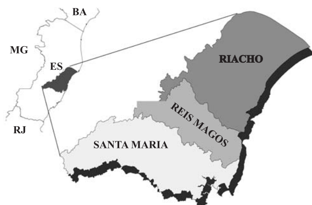
Figura 1. Localização das bacias hidrográficas Riacho, Reis Magos e Santa Maria da Vitória, no Estado do Espírito Santo.

A partir de uma análise conjunta dos mapas de solos e de geologia das três bacias hidrográficas, foram selecionados 56 locais para amostragem, de modo a se obter o maior número de ordens de solos (Quadro 1) e de agrupamentos litológicos representativos do Estado (Figura 2). Para isso, foram utilizados planos de informação, com feições do tipo polígono, obtidos a partir do mapa exploratório dos solos (Embrapa, 1978; IBGE, 2007), mapa geológico (Embrapa, 1978; IEMA, 2007) e o mapa de bacias hidrográficas do Estado do Espírito Santo (IEMA, 2007), todos na escala 1:750.000. Essas informações foram estruturadas em um Sistema de Informações Geográficas (SIG), e os