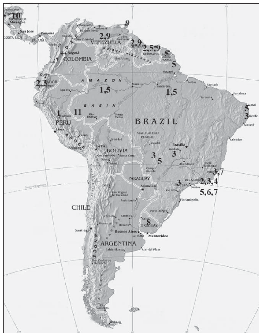
Fig. 14. Distribuição geográfica das espécies conhecidas de Lophoblatta : 1, L. arlei ; 2, L. brevis ; 3, L. speerae ; 4, L. bromelicola ; 5, L. pellucida ; 6, L. tingua ; 7, L. petropolitana ; 8, L. fuliginosa ; 9, L. arawaka ; 10, L. fissa ; 11, L. lurida sp. nov.