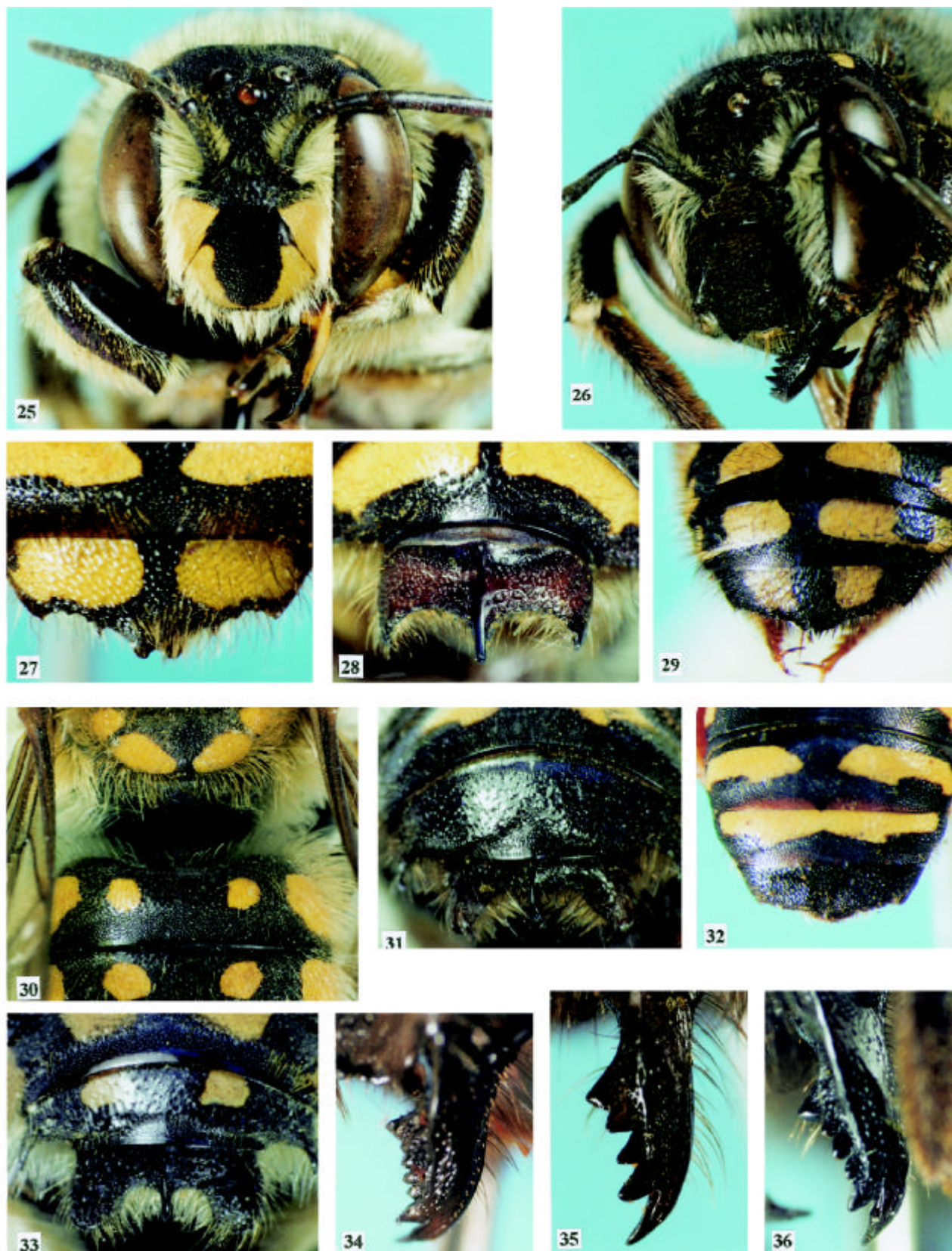
Figs. 25 - 36. 25 - 28, Anthidium andinum : 25, cabeça do macho; 26, cabeça da fêmea; 27, tergos distais da fêmea; 28, tergos distais do macho; 29, A. igori , tergos distais da fêmea; 30 e 33, A. paitense : 30, escutelo, axilas e tergos proximais do macho; 33, tergos distais do macho; 31, A. anurospilum , tergos distais do macho; 32, A. rozeni , tergos distais da fêmea. 34 a 36: mandíbula da fêmea; 34, A. atricaudum , anômala, com sete dentes, 36, mandíbula normal; 35, A. funereum .