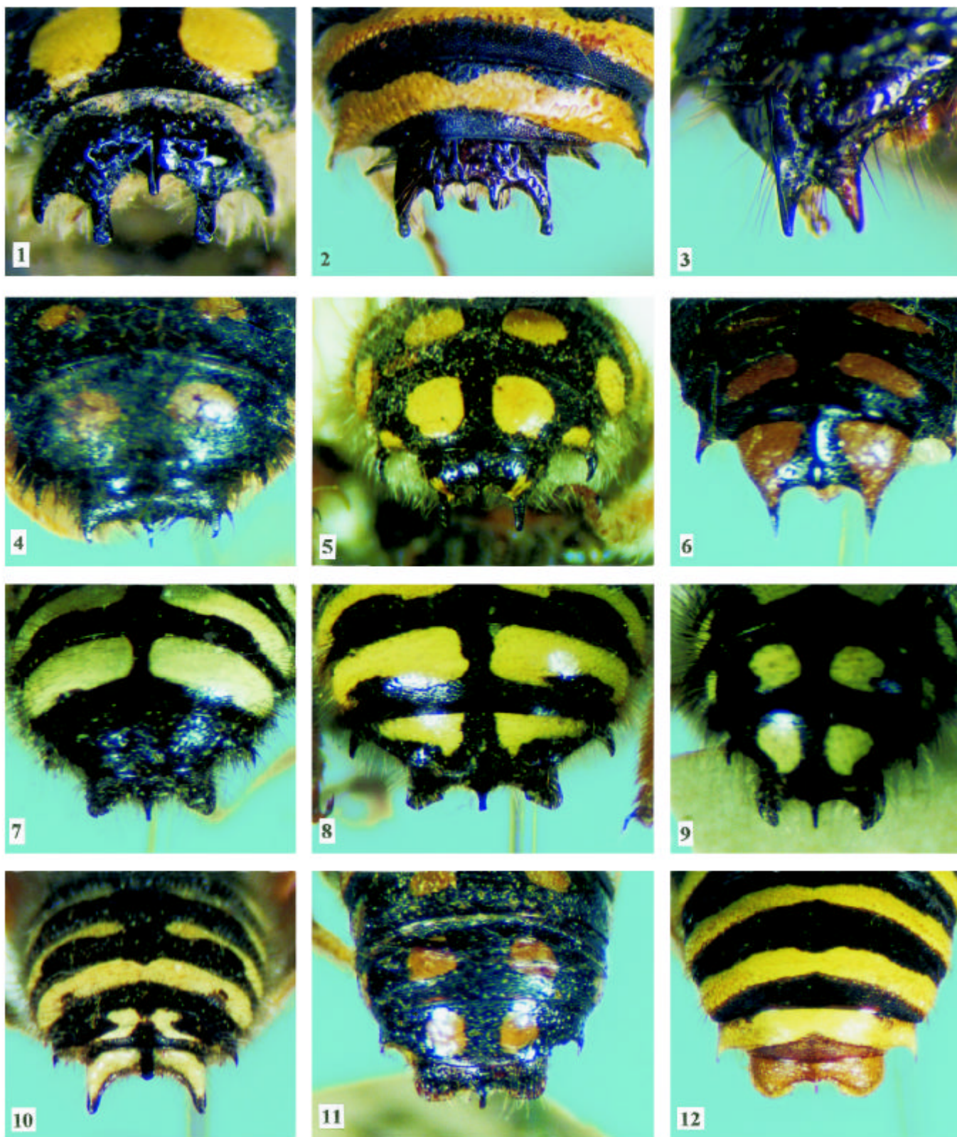
Figs. 1 - 12. Tergos distais dos machos. 1, A. vigintiduopunctatum ; 2, A. latum ; 3, A. nigerrimum ; 4, A. chubuti ; 5, A. deceptum ; 6, A. sertanicola ; 7, A. rubripes ; 8, A. friesei ; 9, A. garleppi ; 10, A. chilense ; 11, A. vigintipunctatum ; 12, A. sanguinicaudum .