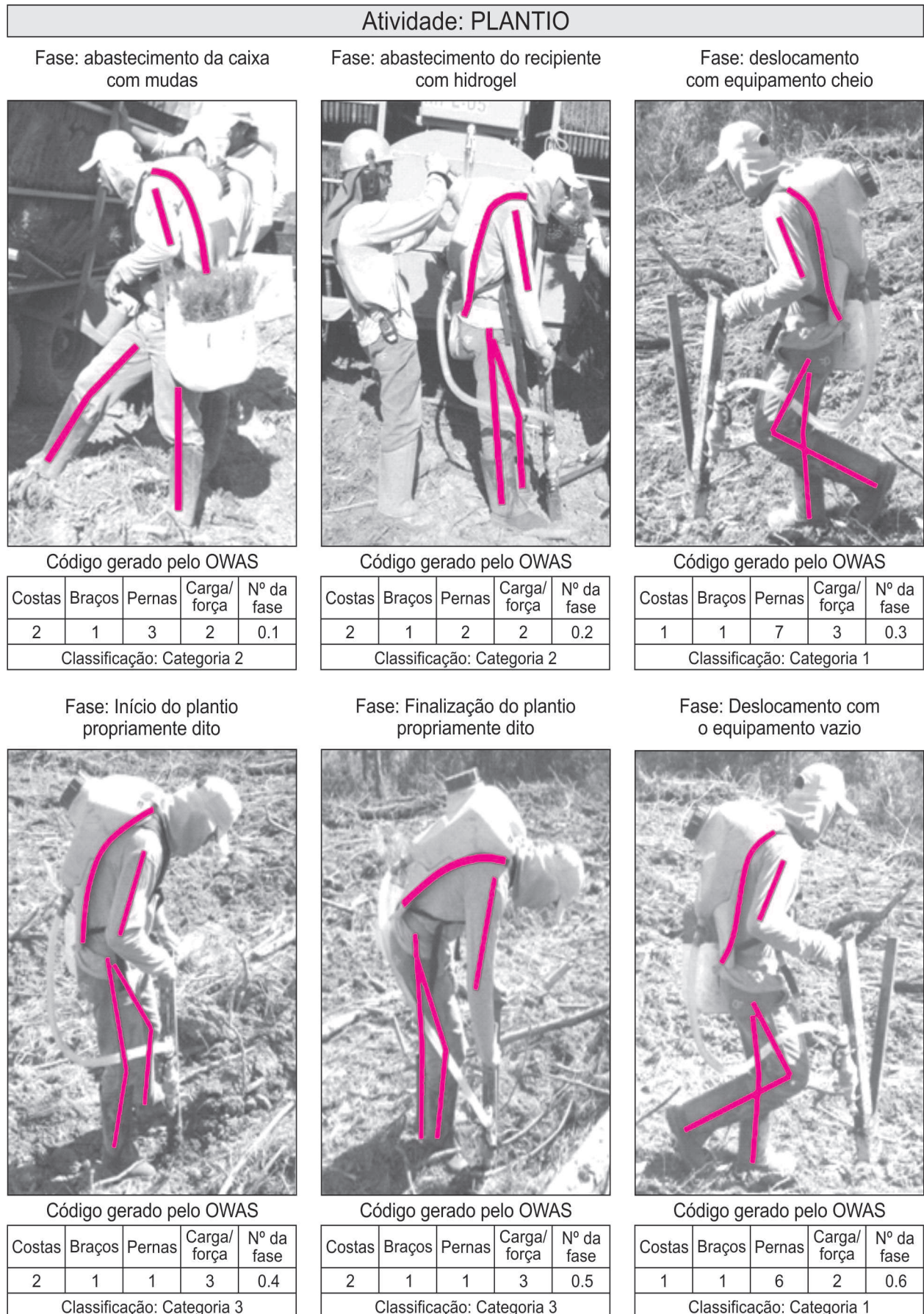
Figura 1. Posturas típicas dos trabalhadores nas fases da atividade de plantio.