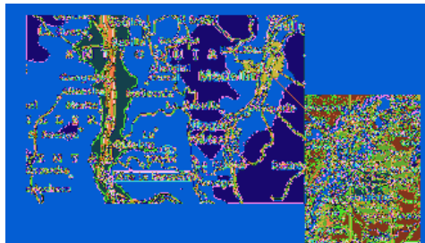
Figura 1: Localización de la mina La Margarita, Figure 1: Margarita mine localization.

En Colombia, La Mina la Margarita se encuentra ubicada al noreste del casco urbano del municipio de Titiribí, en la vereda El Bosque, a 45 Km de Medellín; tiene una extensión de 220.5376,5 ha. A la zona de interés se llega tomando la vía conocida como la Troncal del Café, hasta el corregimiento de Titiribí denominado La Albania, de allí se toma la carretera al casco urbano de dicho municipio por un tramo de 3 Km para desviarse luego a la derecha por la vía que conduce al trapiche de la mina La Margarita (Figura 1).