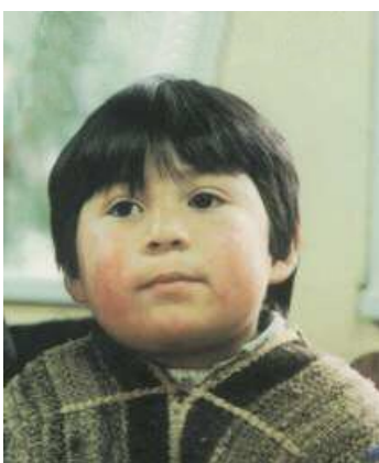
XEG XEG Temuko warria Territorio Mapuche Chile