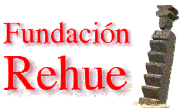
Imagen página de inicio.

Mensajes de quienes han visitado la página con comentarios positivo y apoyo a sus reivindicaciones, posibilita el contacto con quienes han enviado sus mensajes, la mayoría chilenos.