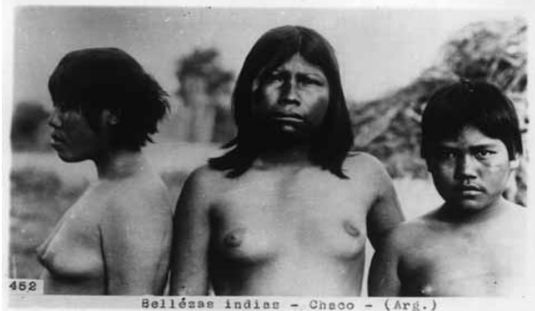
Bellézas indias - Chaco - (Arg.)