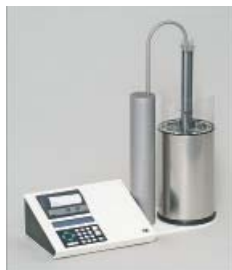
CTE2200-Einfriersystem MTG Medical Technology Vertriebs-GmbH

Besuchen Sie unsere Rubrik Medizintechnik-Produkte