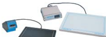
Hot Plate 062 und Hot Plate A3 Labotect GmbH