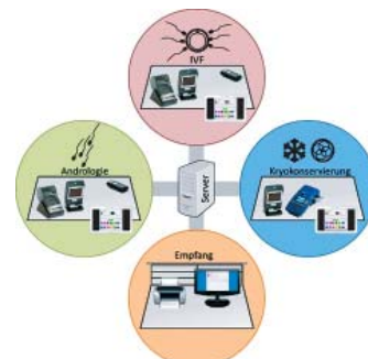
OCTAX Ferti Proof-Konzept MTG Medical Technology Vertriebs-GmbH