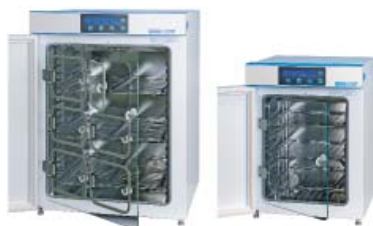
C200 und C60 CO 2 -Inkubatoren Labotect GmbH