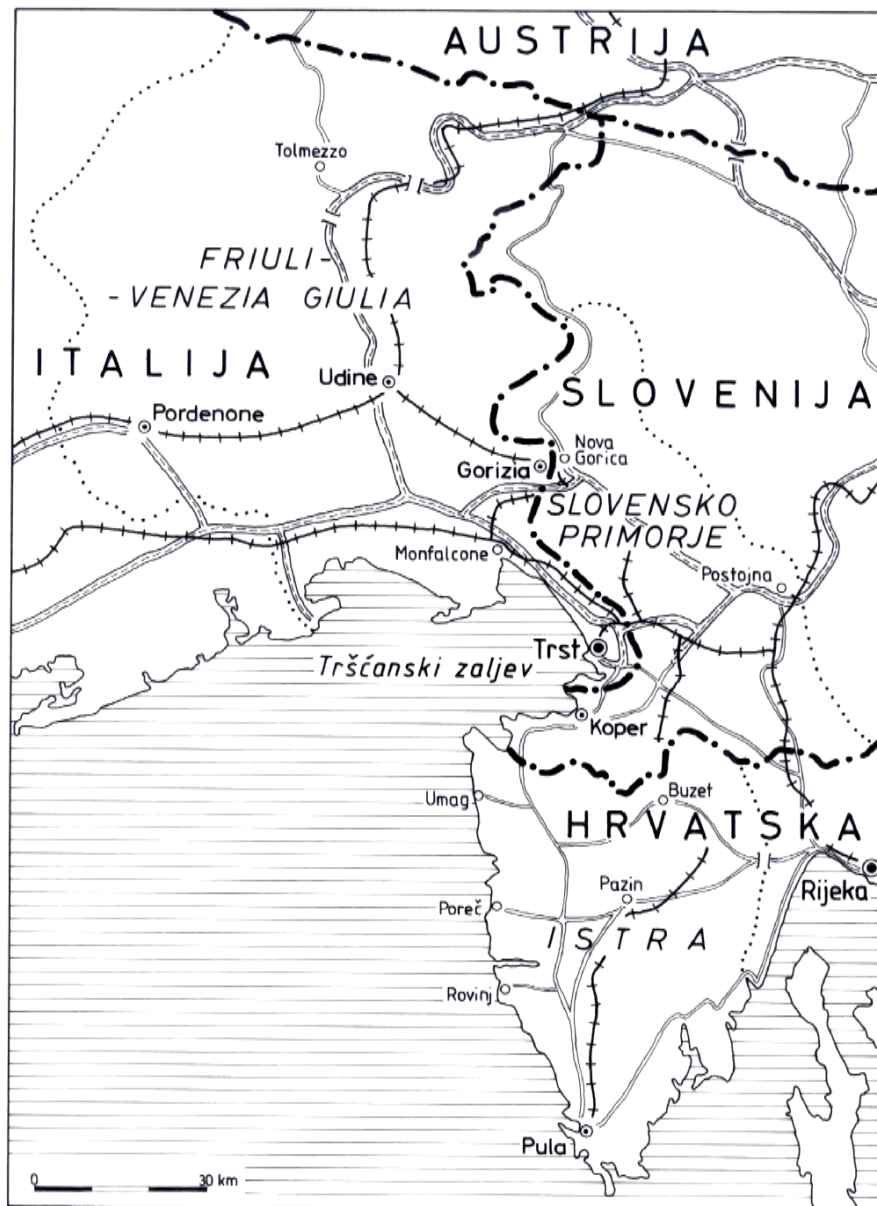
Slika 1: Geografski položaj Istre.