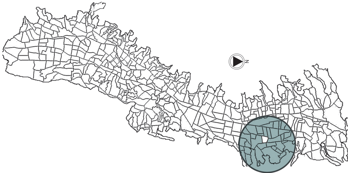
Figura 2. Ubicación San Isidro del Inca en la ciudad de Quito