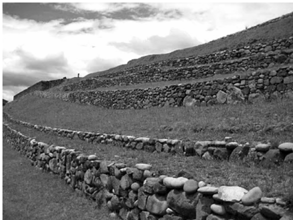
Figura 3. Paisaje andino Ingapirca

y tuvieron un especial cuidado en la disposición y forma de cultivar la tierra, que se mantiene hasta la actualidad. Se guardaba un profundo respeto al medio, no existía una desvinculación entre sujeto-objeto, sino una relación mágica, mítica, festiva con la naturaleza y el espacio. Había una unión entre uku-pacha y kay-pacha , esto es, entre el mundo invisible y el visible.