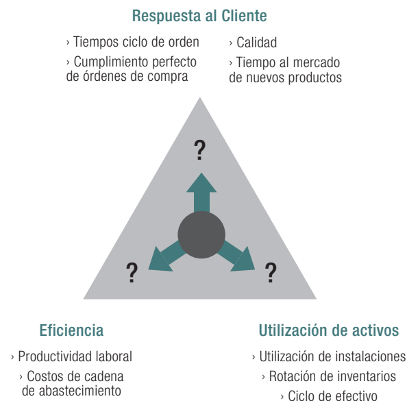
Figura 3. Estrategias operativas de gestión de la cadena de abastecimiento

contribuirán al crecimiento económico agregado y al desarrollo de mercados más sofisticados, característicos también de Silicon Valley y Boston, y de otras ciudades globales como Nueva York, Londres o Tokio. Finalmente, unas industrias relacionadas y de soporte disponibles localmente facilitan el desarrollo de nuevos productos y la generación de riqueza. Las elevadas capacidades y niveles de dinamismo existentes en los clusters hacen que los beneficios sean mayores que los costos, por altos que estos últimos sean, y tienden a generar unos círculos virtuosos caracterizados por la atracción de nuevas empresas y la generación de capacidades y riqueza. Estas ventajas productivas pueden ser aprovechadas luego a escala mundial por intermedio de las redes globales de producción y distribución.