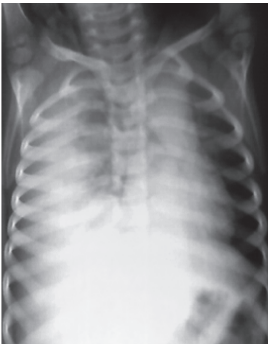
Figura 2. Rx de tórax en decúbito lateral derecho con un derrame mayor al 40% (Paciente 2)..