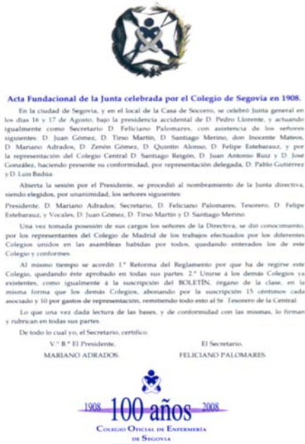
FIGURA I: ACTA FUNDACIONAL DEL COLEGIO DE SEGOVIA.