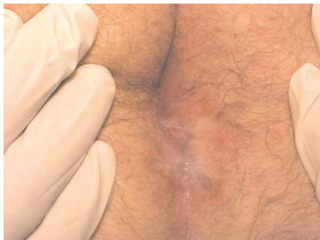
Figura 6 - Cicatrização completa após seis aplicações de triancinolona intralesional e 30 dias de talidomida VO.