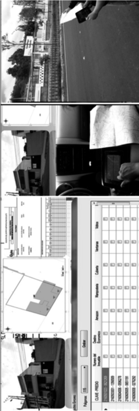
FIGURA 3 METODOLOGÍA DE CONTROL DE CALIDAD EN CAMPO MEDIANTE TABLET PC