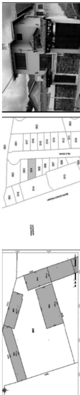
FIGURA 1 CARTOGRAFÍA CATASTRAL BÁSICA