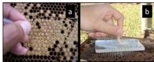
FIGURA 1. (a): Representación de instrumento 1 con aguja de acero inoxidable. (b) Representación del instrumento 2./ (a) Representation of instrument 1 with stainless steel needle. (b) Representation of instrument 2.

La conducta higiénica se determinó por el método de punción de la cría (10), modificado por Gramacho et al. (11) y utilizado por otros autores (3, 7, 12), con la aguja de acero inoxidable (Fig. 1a) y por el empleo del nuevo instrumento (Fig. 1b) (Patente 189/2011) (13).