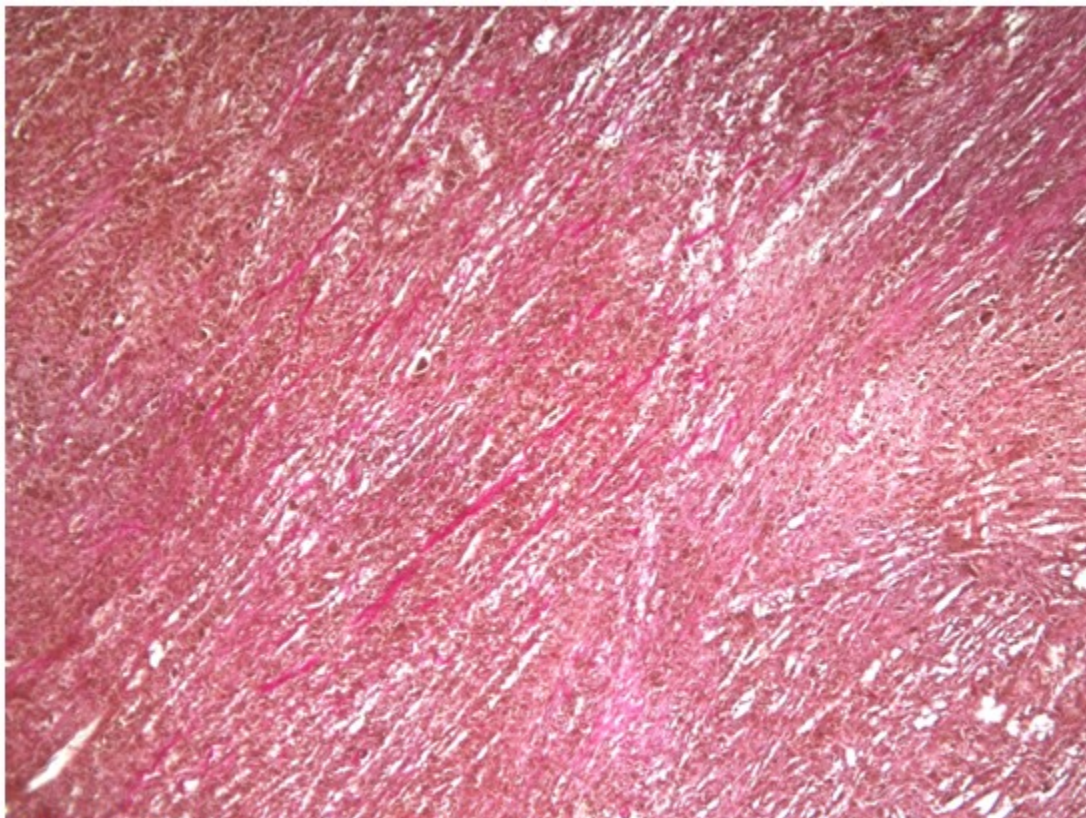
Figura 4. Vista a menor aumento con técnica de van Gieson. Las células tumorales teñidas de amarillo definen el origen muscular liso de la lesión.

Se realizó también la coloración de hematoxilina fosfotúngstica de Mallory en la definición del