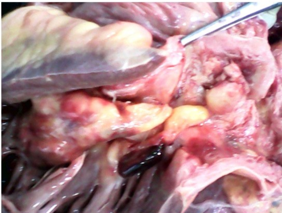
Figura 2. Vista del tracto de salida del ventrículo derecho con engrosamiento de la pared de la arteria pulmonar como consecuencia de la infiltración tumoral.

Al examen histológico, con la coloración de hematoxilina-eosina, las células que