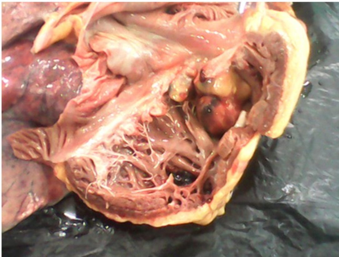
Figura 1. Vista de la cavidad ventricular derecha en la que destaca masa de aspecto tumoral amarillo rojiza multilobulada.

La lesión presentaba bordes infiltrantes y se extendía al miocardio y al cono de la arteria pulmonar. (Figura 2).