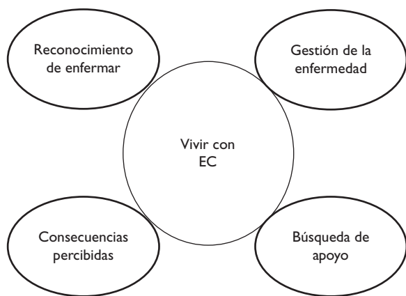
FIGURA 2. MAPA TEMÁTICO FINAL TRAS EL ANÁLISIS DE LAS ENTREVISTAS POR EQUIPO INVESTIGADOR