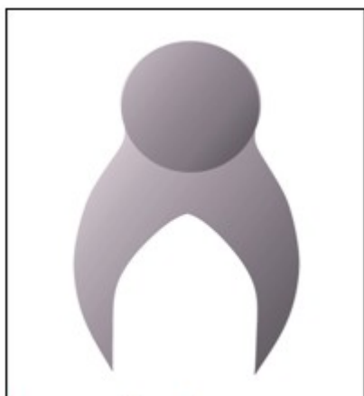
Figura 2. Formas que representan a los ancianos.

Las figuras se encuentran ubicadas en la posición de los cuatro puntos cardinales, formando una especie de ronda en la que los sujetos, enfocados desde una vista superior, elevan las manos sosteniendo el acrónimo identitario (APE) para representar la necesidad de colaboración, solidaridad y esperanza, así como la universalidad del mensaje a transmitir. El acrónimo emerge de una flor blanca (símbolo de la pureza y las causas positivas) formada por la unión de las manos de las figuras. (Figura 3).