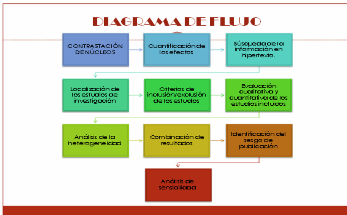
Gráfico 4. Diagrama de flujo en la construcción del meta análisis

La evaluación de las acciones se realiza a partir de la construcción de un forest plot . Este gráfico se construye de manera que en el eje de abscisas (eje X) se represente la medida de efecto considerada ( odds ratio , riesgo relativo , etc.) y a lo largo del eje de coordenadas (eje Y)