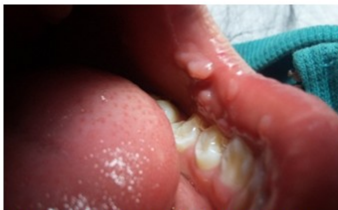
Figura 1. Lesiones papulomatosas a nivel de mucosa oral de los carrillos.

Al examen dermatológico de la cavidad bucal, se encontraron múltiples pápulas ovaladas, con tendencia a agruparse, diseminadas en toda la cavidad bucal y en la lengua, del color de la mucosa oral, de consistencia blanda, de superficie lisa y brillante, de 0,3 mm a 1 cm, no dolorosas. (Figura 1, figura 2 y figura 3).