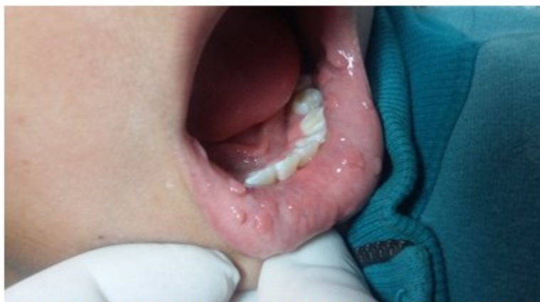
Figura 3. Lesiones papulomatosas con tendencia a agruparse en mucosa de los labios.

El estudio anatomopatológico, realizado el 2 de julio del 2015, reportó lesión exofítica benigna, revestida por epitelio escamoso con acantosis, papilomatosis e hiperqueratosis, con un estroma de vasos sanguíneos congestivos, cambios que guardan relación con los encontrados en la enfermedad de Heck.