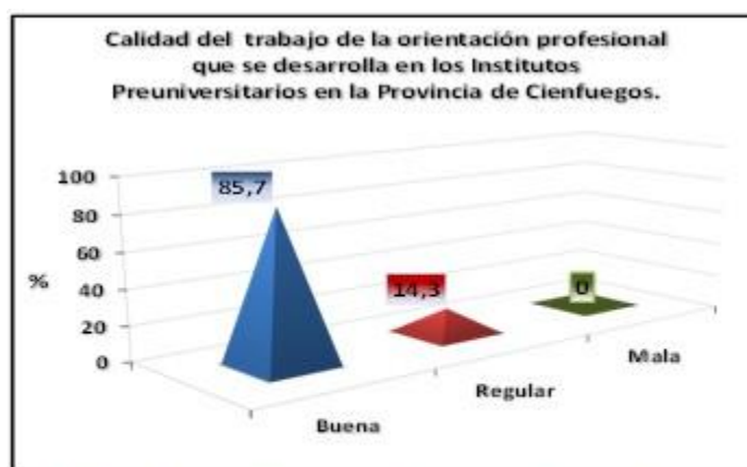
Gráfico 1. Calidad del trabajo de orientación profesional realizado según opinión de los Consejos de Dirección de los institutos preuniversitarios

Los consejos de dirección de 18 preuniversitarios (85,7 %) consideran que el trabajo de orientación vocacional desarrollado con los estudiantes al implementar el sistema de acciones es bueno, mientras que los institutos preuniversitarios Owen Fundora, Armando Mestre y Juan Alberto Díaz lo evalúan de regular (14,3 %), refiriendo que la lejanía de la cabecera municipal es la principal causa. (Gráfico 1).