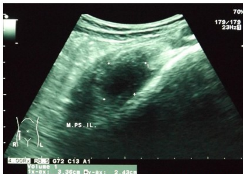
Figura 3. Ecografía pélvica de seguimiento con imagen ovoidea de bordes definidos, heterogénea de predominio hipocogénico compatible con hematoma antiguo con disminución del volumen sin datos de infección.