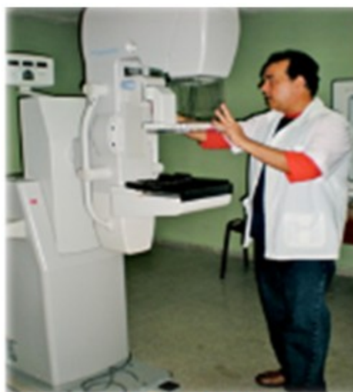
Figura 16. Equipo mamógrafo.

Inicialmente surge el policlínico Área I, nombrado José Luís Chaviano Chávez, situado en la calle Arango entre San Fernando y San Carlos. Inaugurado en 1966, comienza a funcionar como Policlínico Integral contando ya con equipo de rayos x Marca Phillips. En la actualidad ocupa una nueva edificación, situada en calle 25 entre 46 y 48 y cuenta con equipo de rayos X convencional marca Shimadzo. En 1971 surge el