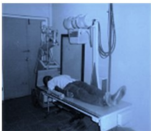
Figura 11. Equipo de rayos X convencional de Urología y equipo portátil (1979).