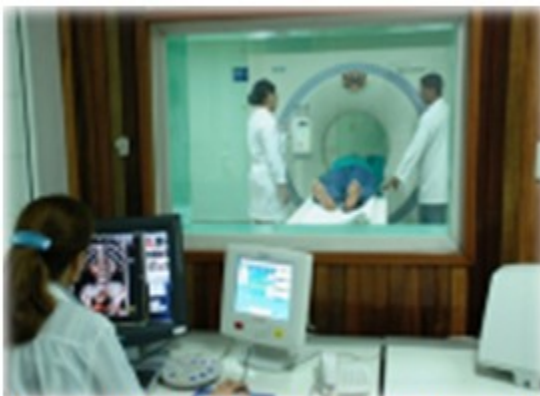
Figura 14. Equipo de Tomografía Axial Computarizada.

multicorte, resonancia magnética por imágenes (RMI), densitómetro, mamografía, intensificador de imágenes, ultrasonidos y equipos convencionales para estudios simples y contrastados. (Figura 14, 15 y 16).