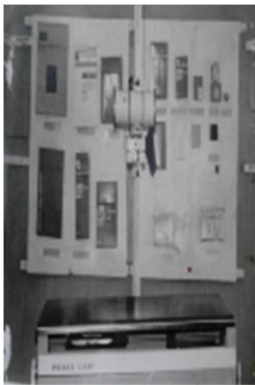
Figura 9. Equipo de rayos x convencional marca Picker.