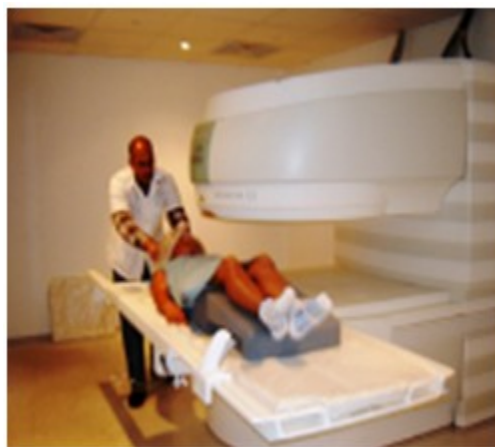
Figura 15. Equipo de resonancia magnética por imágenes (2007).