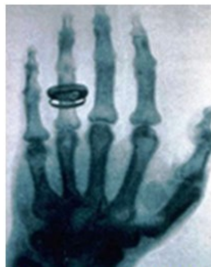
Figura 2. Radiografía tomada por Wilhelm Röntgen en 1896 a su esposa.

decidió entonces a practicar la prueba con humanos, la primera radiografía la realizó a su esposa. 1-3 (Figura 2).