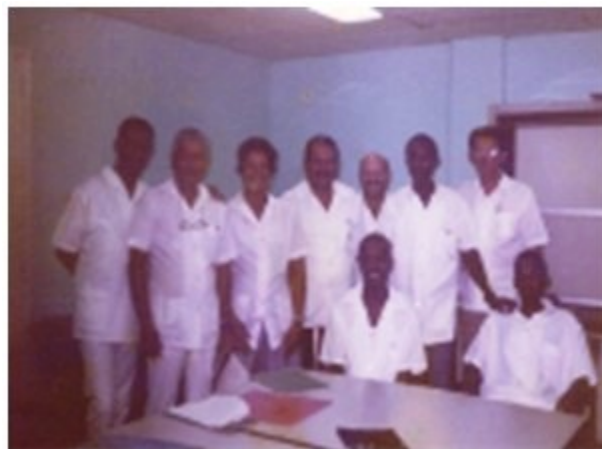
Figura 18. Profesores junto a estudiantes extranjeros al finalizar un examen práctico estatal.

(Figura 18), y cubanos, tanto de Cienfuegos como de otras provincias, pues se contaba con una gran cantidad de recursos humanos de la especialidad. En ese año comienzan a realizarse cursos de especialización o pos básicos de exámenes especiales de las provincias de Cienfuegos, Santiago de Cuba y Las Tunas, y hasta el 1993 se formaron 18 especialistas.