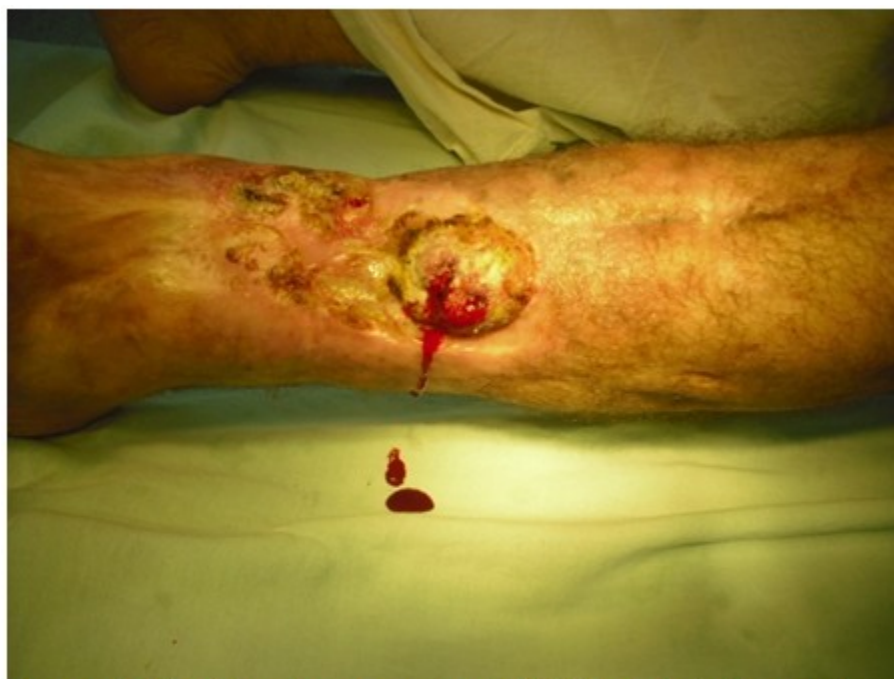
Figura 2. Vista frontal que muestra la friabilidad de la úlcera así como el sangrado fácil.