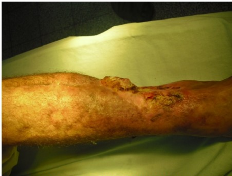
Figura 1. Vista lateral que muestra la úlcera sobre la cicatriz vegetante y de rápido crecimiento.