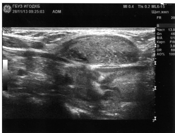
Рис. 1. Эхограмма образования мягких тканей шеи (в-режим).