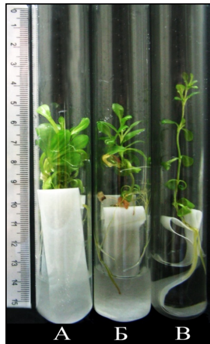
Рис. 1. Зміна габітусу культивованих in vitro рослин G. lutea популяції г. Шешул-Павлик за різних світлових режимів їх вирощування: А – другий варіант світлової корекції; Б – перший варіант світлової корекції; В – контроль

витку листової поверхні (LAR). Відмінність контрольних рослин достовірно не значна лише від параметра SLA рослин першого варіанта СК (у випадку г. Пожижевська та г. Шешул-Павлик); за іншими параметрами рослини контрольної групи статистично достовірно ( P < 0,001 ) відрізняються від обох варіантів досліді.