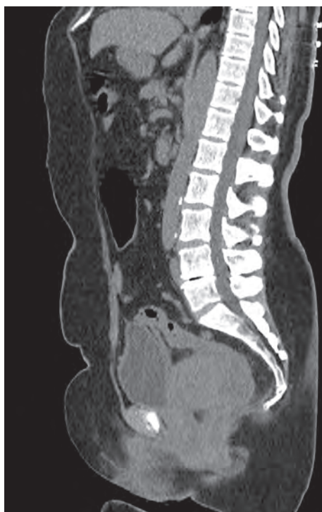
Рис. 4. Рак среднеампулярного отдела прямой кишки. КТ-грамма малого таза: опухоль прорастает матку и влагалище.

Компьютерная томография (рис. 4). Используется для установления местной распространенности опухолевого процесса, а также выявления метастазов в регионарных лимфатических узлах.