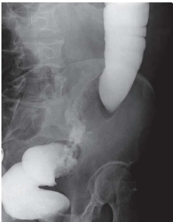
Рис. 3. Рак верхнеампулярного отдела прямой кишки. Ирригированная рентгенограмма: на 12 см от ануса определяется циркулярное сужение (1 см) за счет опухолевой инфильтрации протяженностью до 8 см.

Компьютерная томография (рис. 4). Используется для установления местной распространенности опухолевого процесса, а также выявления метастазов в регионарных лимфатических узлах.