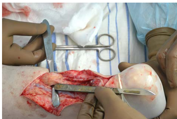
Рис. 1. Дефект между концами пяточного сухожилия 5 см (III степень по Myerson).

Оценить эффективность лечения пациентов с застарелыми разрывами пяточного сухожилия с дефектами III степени по Myerson (рис. 1), которым выполнена пластика пяточного сухожилия по Чернавскому с иммобилизацией оперированной нижней конечности короткой гипсовой шиной в течение 4 недель.