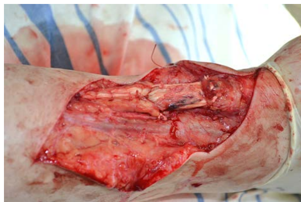
Рис. 3. Вид замещенного диастаза между проксимальной и дистальной культей пяточного сухожилия.

Свободный конец сухожильного лоскута прошивается нерассасывающимся шовным материалом. Дистальная культя пяточного сухожилия рассекается в горизонтальной плоскости. Полученный сухожильный лоскут низводится к дистальной культе пяточного сухожилия и внедряется в ее рассеченную поверхность, затем выполняется шов (рис. 3). Дефект в области забора сухожильного лоскута ушивается рассасывающимся шовным материалом.