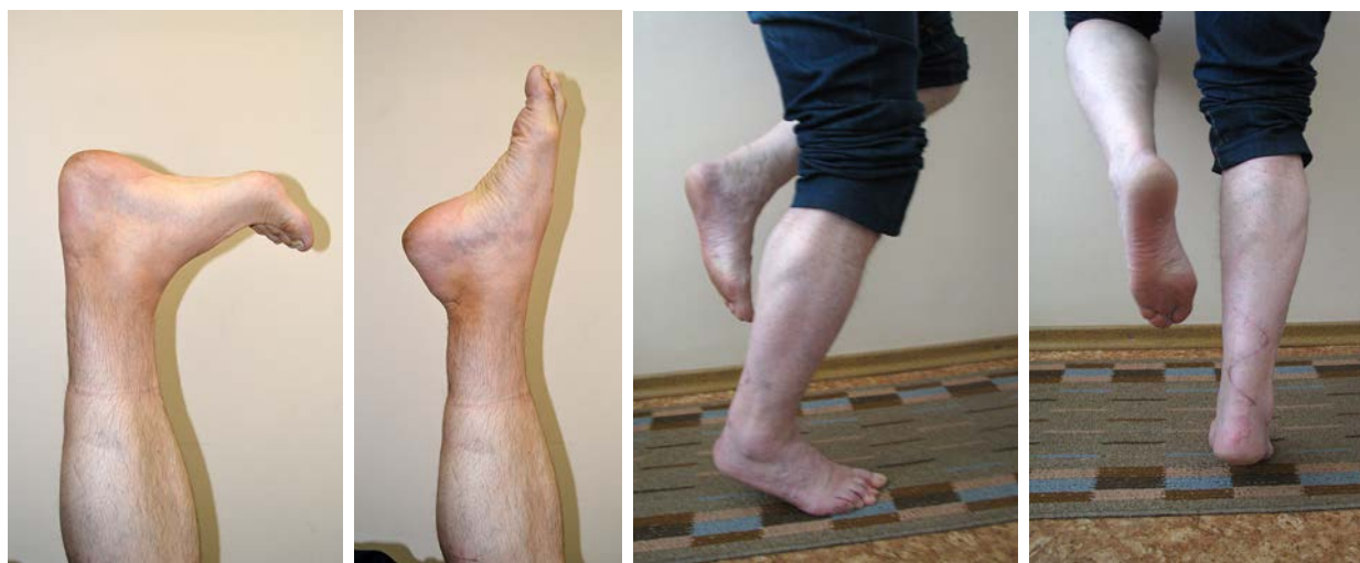
Рис. 5. Функциональные результаты через 3 месяца после оперативного лечения.

Пациент рандомизирован в основную группу, 16.01.14 г. выполнена операция: пластика застарелого разрыва ахиллова сухожилия справа по Чернавскому. После операции правая нижняя конечность иммоби-