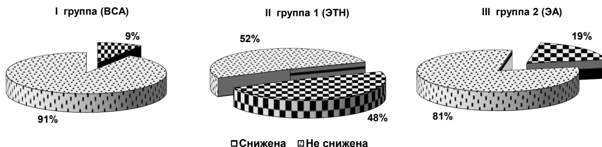
Рис. 1. Количество пациентов с изменением гемодинамики в группах. Различия между группами BCA – ЭТН статистически значимы при p = 0,002 ; BCA – ЭА – при p = 0,03 ; ЭТН – ЭА – при p = 0,004 .