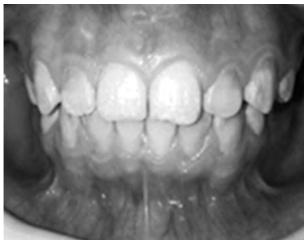
Рис. 6. Пациентка Н., 12 лет. Оклюзия после ортодонтического лечения.

В процессе проведённого лечения была создана окклюзия, соответствующая эстетической и функциональной норме (рис. 6).