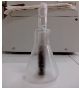
(a) Biakan awal A. niger

(Gunam dan Antara, 1999). Ion \text{OH}^- dari NaOH akan memutuskan ikatan-ikatan dari struktur dasar lignin sedangkan ion \text{Na}^+ akan berikatan dengan lignin yang belum terputus ikatannya membentuk natrium fenolat. Garam fenolat ini bersifat mudah larut. Lignin yang terlarut ditandai dengan warna hitam pada larutan yang disebut lindi hitam ( black liquor ) (Safaria, dkk., 2013).