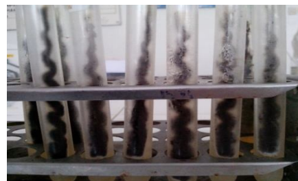
(b) Perbanyakan A. niger