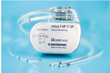
Neues CRT-D Implantat Intica 7 HF-T QP von Biotronik