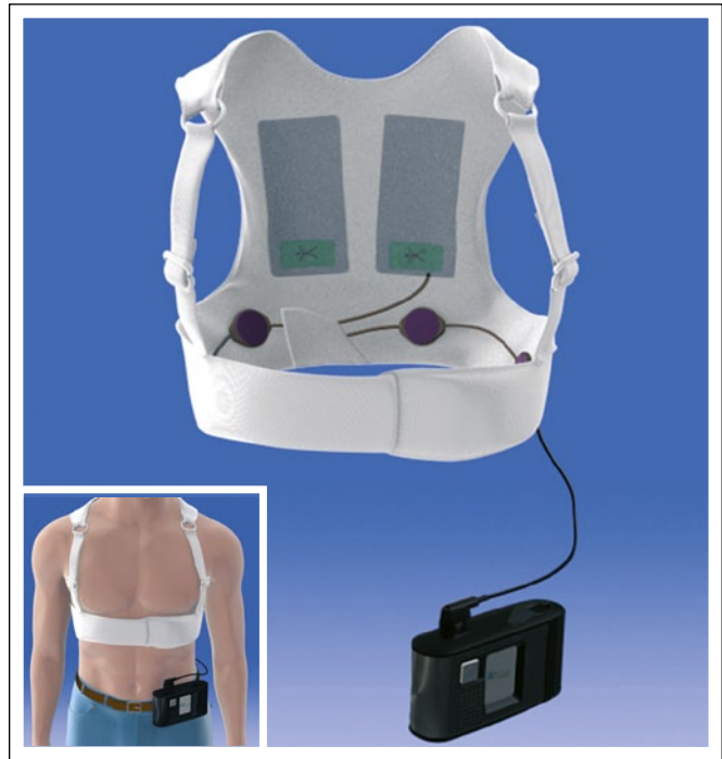
Abbildung 1: Der tragbare Kardioverter-Defibrillator (Wearable Cardioverter Defibrillator, WCD).

Eine Verschreibung des WCD setzt eine grundsätzliche Kenntnis der Indikationen sowie der Funktionsweise des WCD voraus. Da die Mehrzahl der WCD-Patienten in weiterer Folge einen ICD erhalten, ist es für den Verschreiber eines WCD Vor-