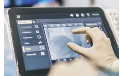
Philips Azurion: Innovative Bildgebungslösung