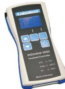
InControl 1050 Labotect GmbH