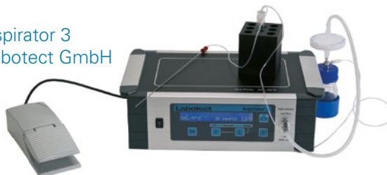
Aspirator 3 Labotect GmbH