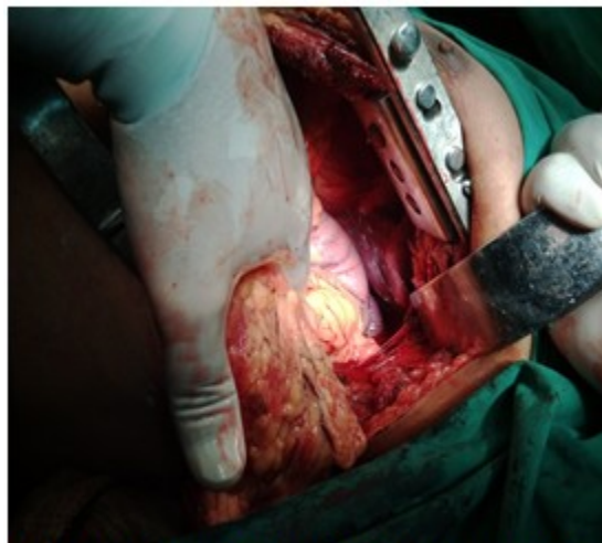
Figura 1: Apertura de la cavidad torácica izquierda, donde se observa epiplón, estómago y pulmón colapsado.

donde se observa epiplón, estómago y pulmón colapsado.