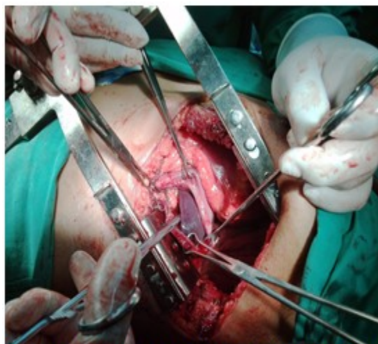
Figura 2: Bordes del diafragma lesionado, tomado con pinzas de Backcock, para introducir los órganos a la cavidad abdominal y comenzar la frenorrafia.

Se realizó una frenorrafia. (Figuras 2 y 3).