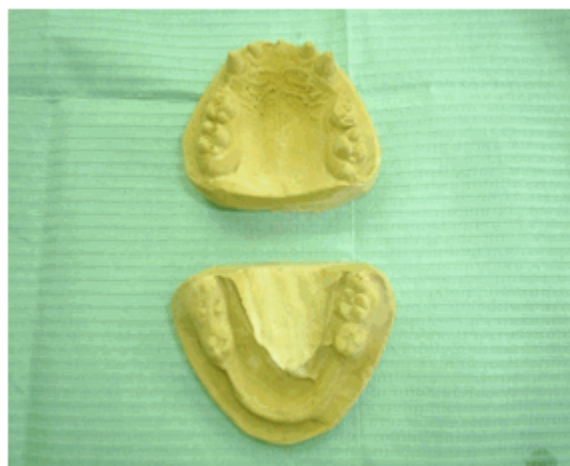
Figura 5. Modelos de estudio del segundo caso clínico.

La radiografía panorámica ratificó las observaciones realizadas en el examen bucal y aportó la ausencia de folículos y brotes dentarios que pudieran impedir el recambio.