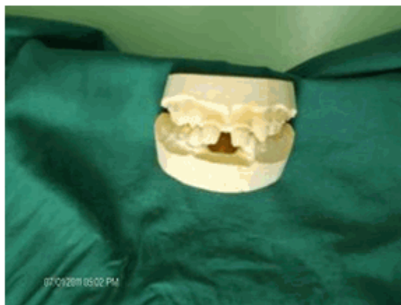
Figura 1. Modelos de estudio del primer caso clínico

molares y caninos temporales están presentes, estos últimos con forma de cono. (Figura 1)