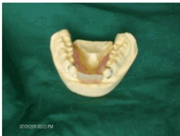
Figura 2. Prótesis parcial deacrílico inferior del primer caso.

familiares, se consideró oportuno realizar una prótesis parcial deacrílico inferior con unos retenedores de acero labrados en algunos de los dientes presentes en las arcadas, lo que permitiría introducir algunas modificaciones de ser necesario. (Figuras 2 y 3)