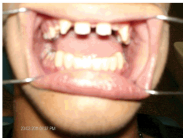
Figura 11. Instalación.