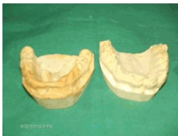
Figura 8. Modelos de estudio del tercer caso.

Al examen bucal se observó oligodoncia de los incisivos laterales superiores y forma conoide de los caninos superiores. En la mandíbula los cuatro incisivos inferiores estaban ausentes, con una amplia brecha edente; los caninos y primeras bicúspides inferiores, también mostraron forma conoide; los molares inferiores estaban presentes. (Figura 8)