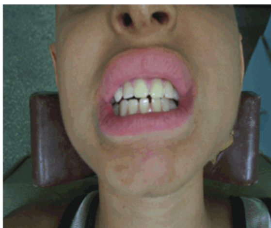
Figura 7. Instalación.