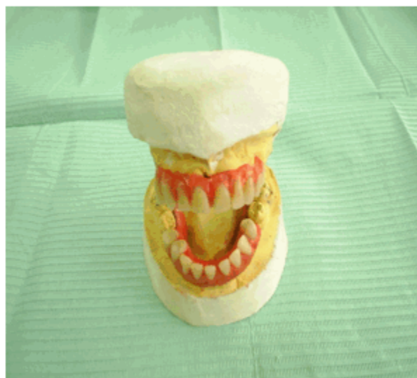
Figura 6. Montaje de dientes de la sobredentadura parcial superior y de la prótesis parcial inferior del segundo caso.

sobredentadura parcial superior y prótesis parcial removible inferior. (Figuras 6 y 7). La sobredentadura se colocó sin realizar preparaciones dentarias y con retenedores labrados en los molares presentes.