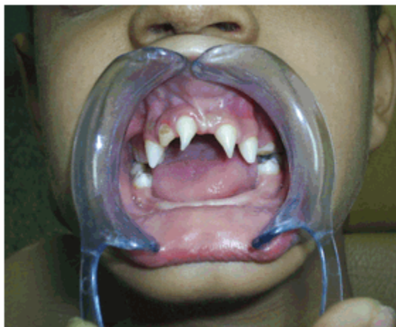
Figura 4. Oligodoncias y dientes con formas anómalas.

Al examen bucal del maxilar, se observó la presencia de cuatro dientes de forma conoide en el sector anterior y cuatro molares en el sector posterior, dos a cada lado; en la mandíbula se observaron cuatro molares y ausencia total del resto de los dientes. (Figuras 4 y 5)