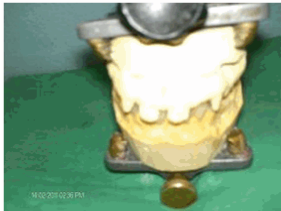
Figura 10. Análisis de la oclusión dentaria.

El seguimiento de este paciente se realizó en la consulta, llevando la rehabilitación según sus requerimientos, velando periódicamente la necesidad del cambio de la prótesis hasta tanto el crecimiento y desarrollo normal de los