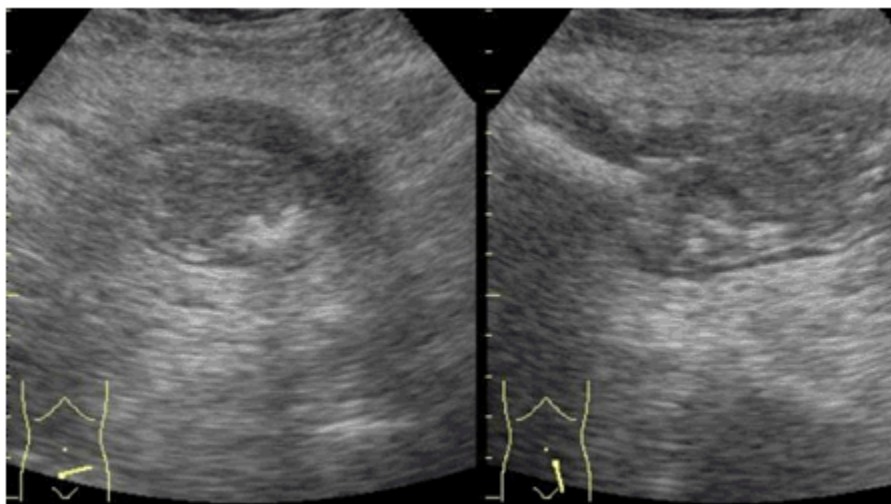
Figuras 1 y 2. Perspectiva de la ultrasonografía que muestra imagen de falso riñón.

Radiografía de colon por enema: Defecto de lleno a nivel de la unión recto-sigmoidea, que se