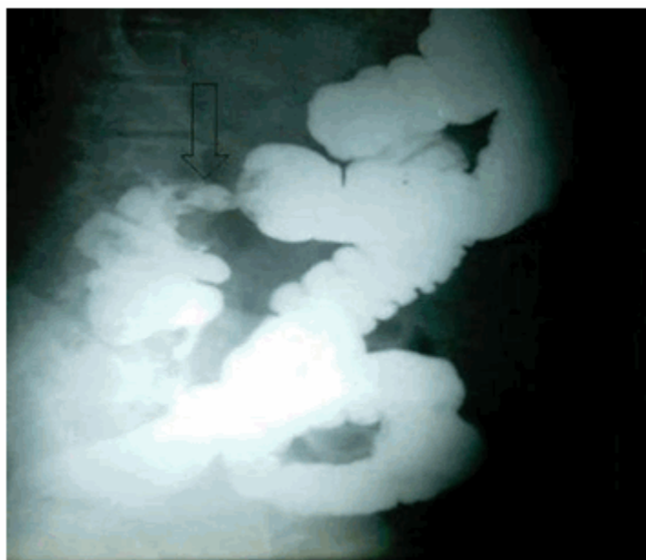
Figura 8. Rayos X de colon por enema donde se observa imagen por defecto de lleno en relación con cáncer de colon ascendente.

que se mantuvo en todas las vistas, lo cual está en relación con neoplasia a ese nivel. (Figura 8)