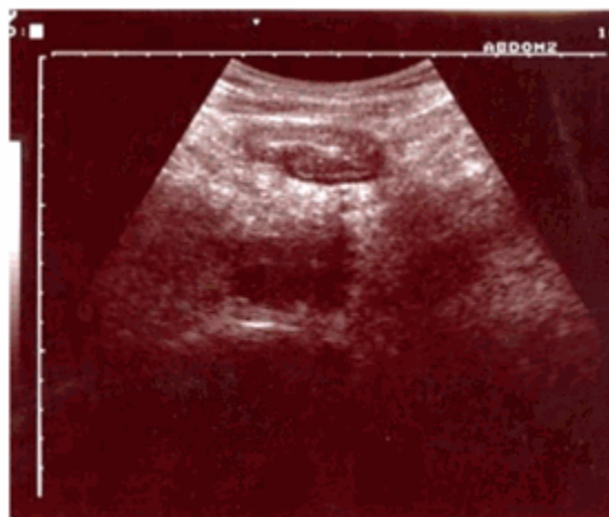
Figura 7. Perspectiva de la ultrasonografía

Radiografía de colon por enema: Se observó defecto de lleno a nivel del colon ascendente,